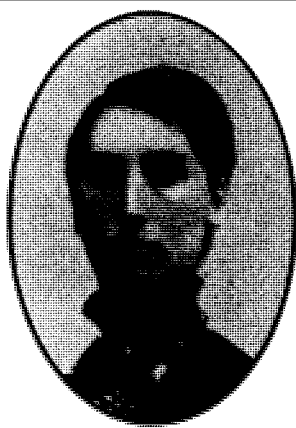
35 (?) år