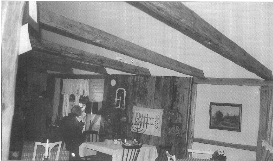
När innerväggar revs efter en brand 1999 hittades gamla ytterväggar från 1600-talet. Det var alltså inte fråga om något svartbygge från 1900-talet, som man trott. Interiör från det rivsamma caféet inne på gården i Victoriagallerian.

De som jobbar med bygget har blivit lika intresserade som jag av husen och deras historia.